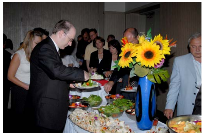
Quelques membres de la Chambre au buffet, du Rouge Vin